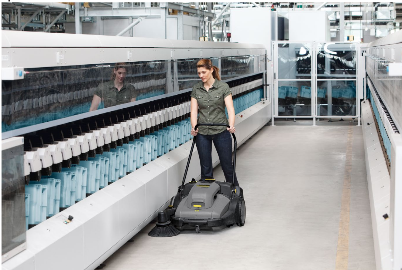
KM 70/30 C Vp Pack Adv